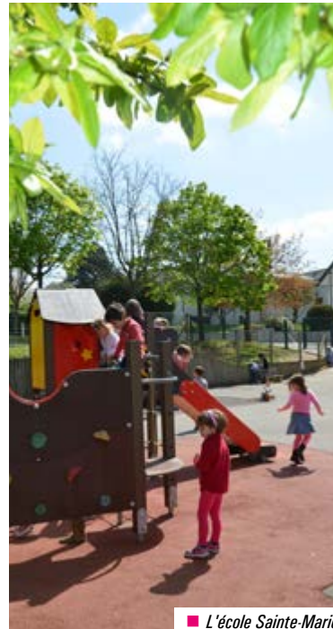
■ L'école Sainte-Marie

La ville a apporté son soutien à l'OGEC (Organisme de Gestion de l'Enseignement Catholique) École Sainte-Marie pour l'organisation des Temps Éducatifs Périscolaires (TEP), dans le cadre de la réforme des rythmes scolaires mise en place en septembre 2014. Avec le retour à la semaine de 4 jours, il est proposé de confirmer la volonté d'une cohérence éducative sur le territoire et d'accompagner l'OGEC, dans la mise en oeuvre d'animations sur le temps méridien. A ce titre, une convention est conclue pour le versement d'une subvention annuelle