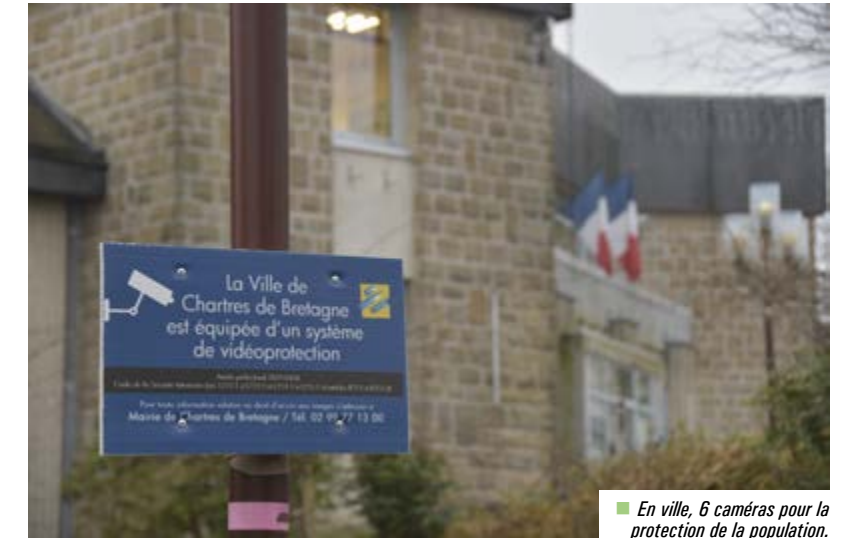
En ville, 6 caméras pour la protection de la population.

Six caméras sont déjà installées en centre-ville : parking place de la Liberté ; parking du centre commercial ; rond-point du Centre ; rond-point René Cassin ; esplanade des Droits de l'Homme et place René Cassin. Sept autres seront déployées sur la commune d'ici fin 2020. Chaque implantation s'appuie sur un diagnostic de sécurité établi par la Gendarmerie et la Police municipale. De plus, des panneaux visibles informent les habitants de l'existence de ce système.