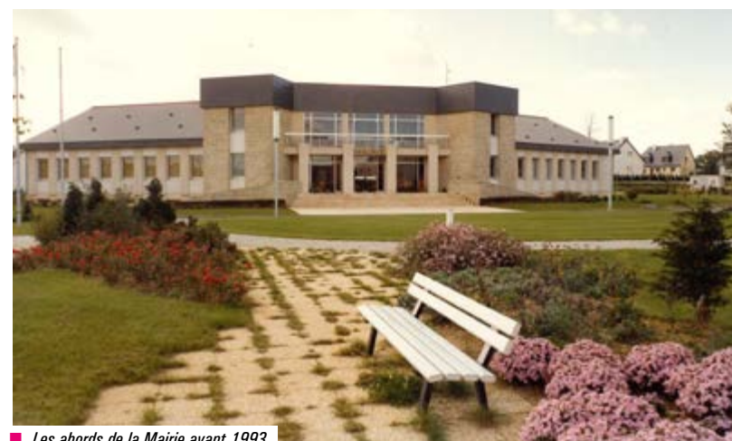
Les abords de la Mairie avant 1993.