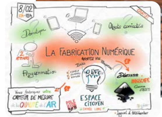
■ Premier atelier autour du numérique... Rendez-vous le 8 février pour le prochain.