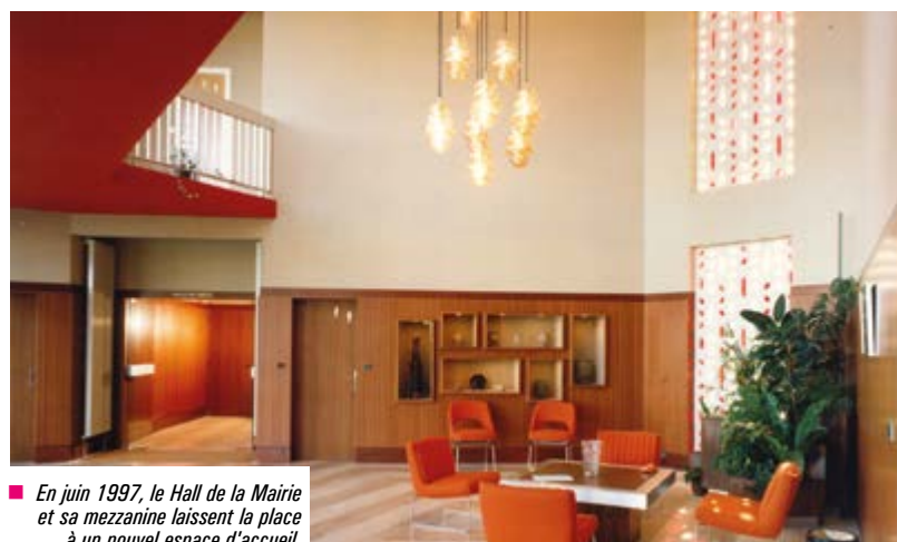
En juin 1997, le Hall de la Mairie et sa mezzanine laissent la place à un nouvel espace d'accueil.