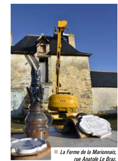
■ La Ferme de la Marionnaise, rue Anatole Le Braz.

lisés par deux adhérents de l'association chartraine Atelier Poterie : "Nous avons pu bénéficier du prêt d'un épi de faïtage, réalisé en 2010 par l'arrière-grand-père d'un Chartrain, l'un des derniers potiers à Chartres. Il a servi de modèle, notamment au niveau des formes et ornements. Les techniques anciennes ont été utilisées afin de respecter l'esprit de la restauration de la Ferme de la Marionnaise. Des recherches ont été nécessaires pour choisir la bonne terre, pour déterminer les bonnes courbes de cuisson et pour trouver le bon émailage sans utiliser de plomb".